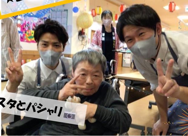
バリスタとパシャリ📷