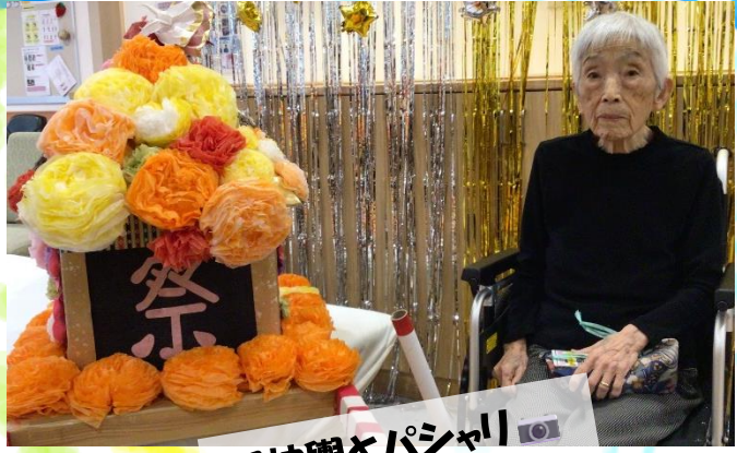
御神輿とパシャリ📷