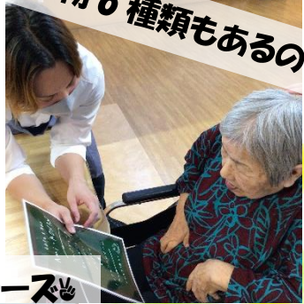
飲み物6種類もあるの?!