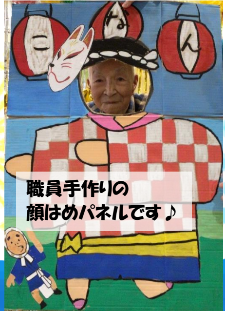
職員手作りの顔はめパネルです♪