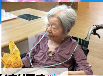
待ちに待ったお祭りのはじまりです 🎉