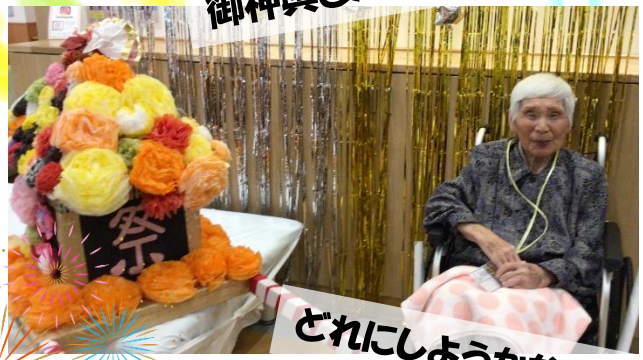
どれにしようかな...