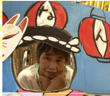
顔はめパネル大好評でした ✨