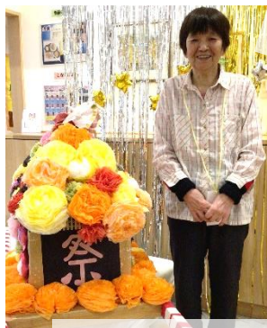
笑顔でおい、チーズ🧀