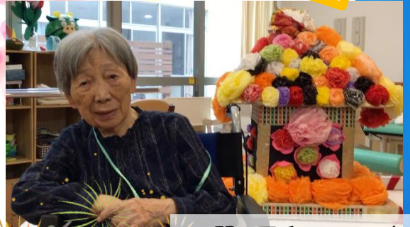
お祭り日和でした ✨