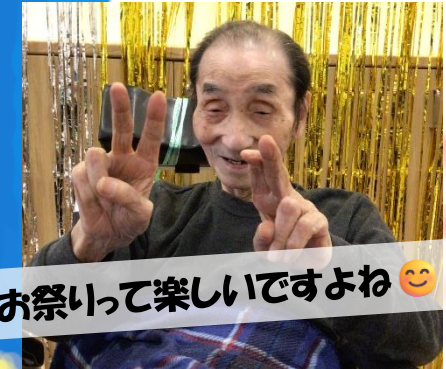
お祭って楽しいですよ😊